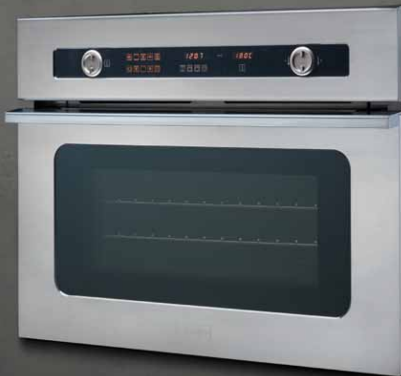
KBS 98 M (multifunzione)