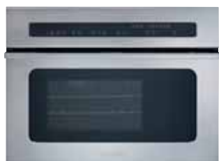
FSO 450 KB (vapore)

Cassetto h 14 per allineamento modulo 60 0390007