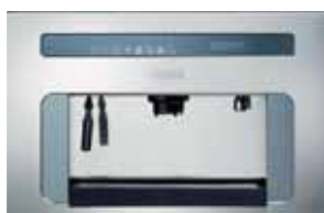
FCM 380 KB (macchina per caffè)

Dimensioni 595x300x390 Programmi Espresso, Caffè lungo Programmatore Elettronico Funzioni Caffè, Acqua calda, Vapore Tipologia caffè Grani Erogazione caffè 1 o 2 tazze Pulsantiera 8 tasti a sfioramento con led di segnalazione Display Digitale Regolazione macinatura Manuale Decalcificazione con filtro integrato nel serbatoio Serbatoio acqua (lt) 2,5 Capacità recipiente caffè in grani (gr) 250 Nota