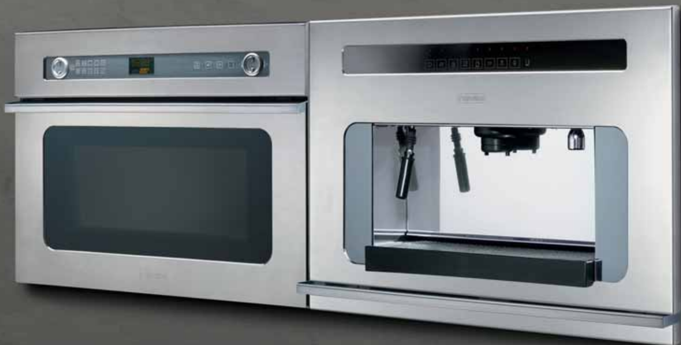
FMW 400 KU (microonde combinato)